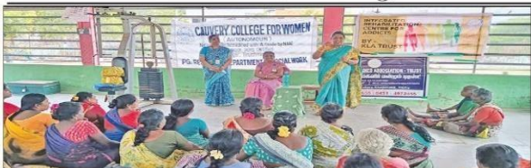
காவேரி மகளிர் கல்லூரி சார்பில்