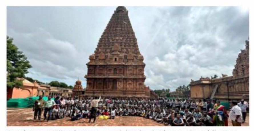
South zone NSS volunteers participating in the pre-Republic Day camp hosted by Cauvery College, Tiruchi, at the Big Temple in Thanjavur.

The National Service Scheme (NSS) volunteers attending a 10-day south zone pre-Republic Day selection camp hosted by Cauvery College for Women and and Ministry of Youth Affairs and Sports, Regional Directorate, Chennai recently enjoyed a field trip to Brihadeeswarar Temple in Thanjavur and to Sri Ranganathaswamy Temple in Srirangam. The camp included fitness training, parade activities, and academic sessions. A total of 200 volunteers and 10 contingent leaders representing Tamil Nadu, Kerala, Karnataka, and Puducherry are participating in the camp. Cauvery College inaugurated its NSS Cell on October 30 with cultural programmes presented by students. Bharathidasan University vice-chancellor M. Selvam and NSS regional director S. Sayeeram spoke.