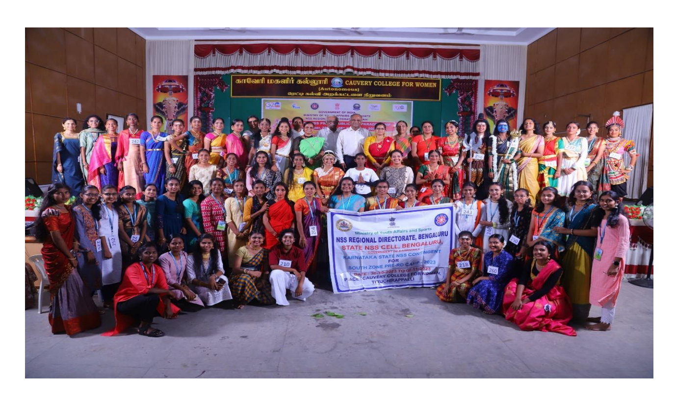
Group Photo of Karnataka Contingent after the cultural performance