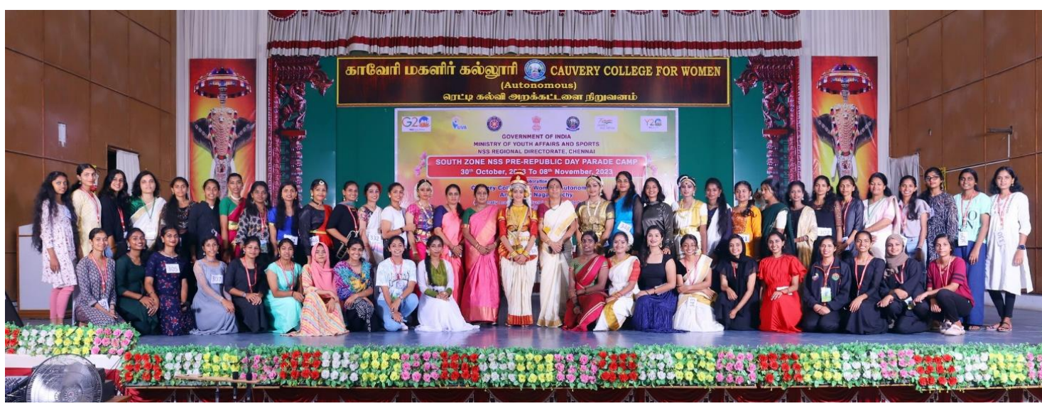
Group Photo of Kerala Contingent after the cultural Programme