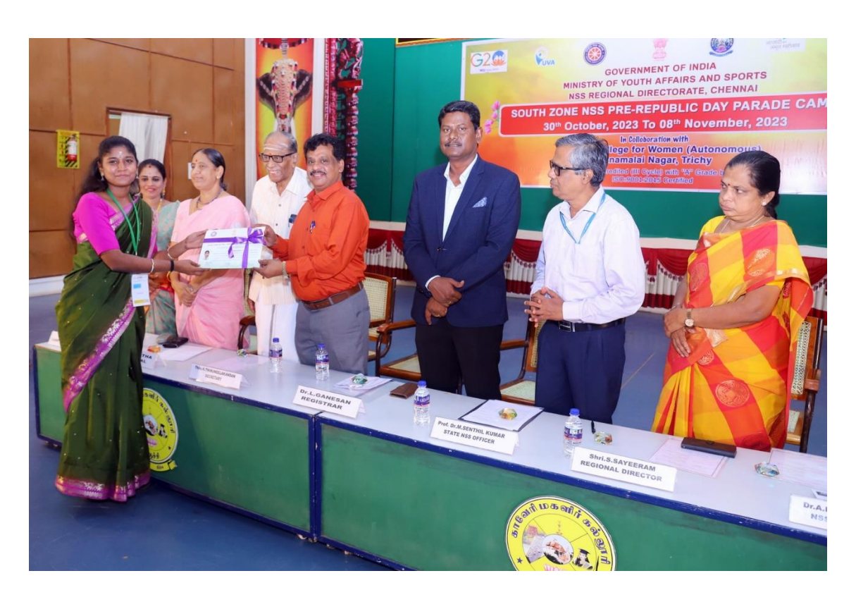
Puducherry Contingent received their participation certificate