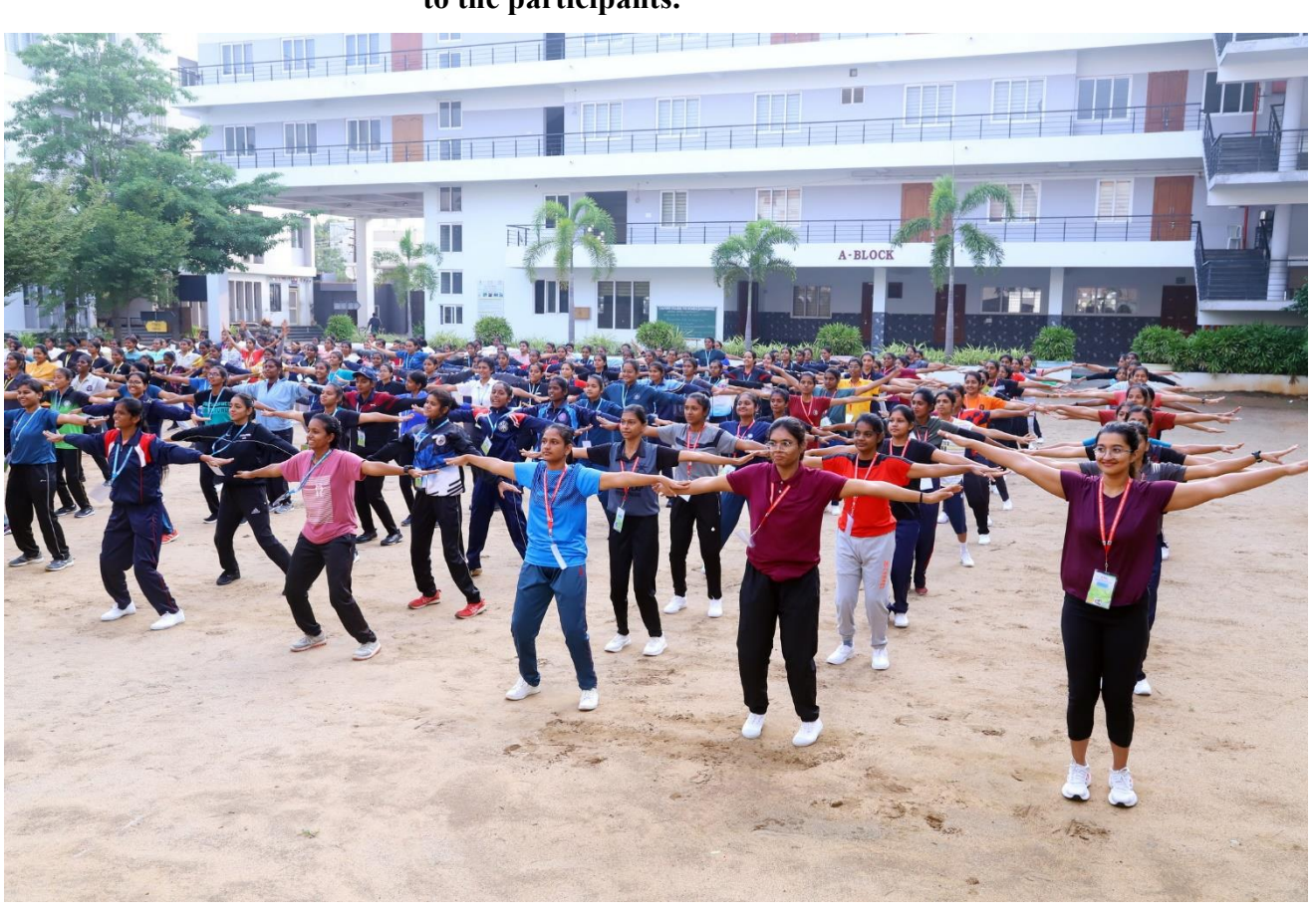
Participants in the Fitness Training