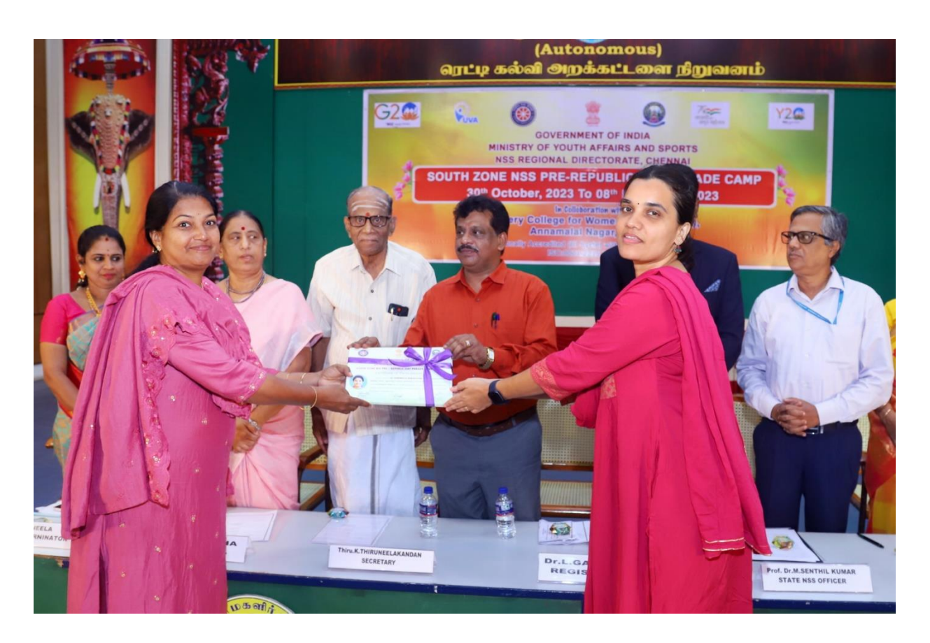
Kerala Contingent received their participation certificate