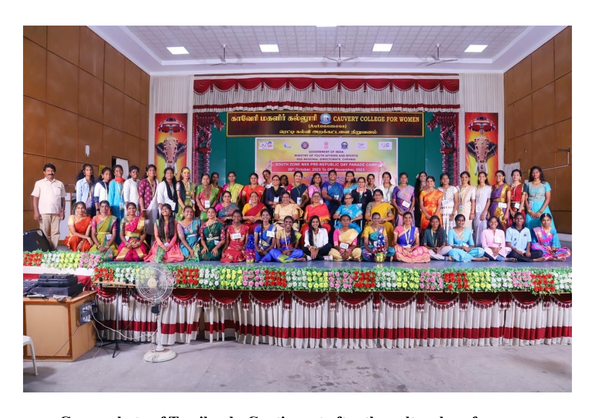
Group photo of Tamilnadu Contingent after the cultural performance