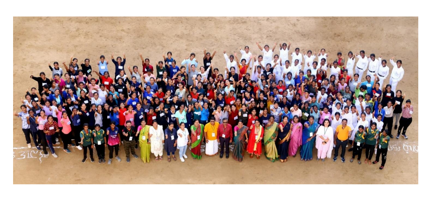
Contingent leaders at Fitness centre of Cauvery College for Women