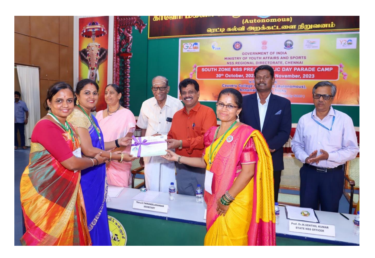
Karnataka Contingent received their participation certificate