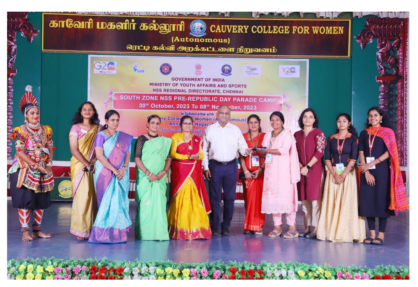
Karnataka Contingent handed over the NSS Flag to Kerala Contingent.