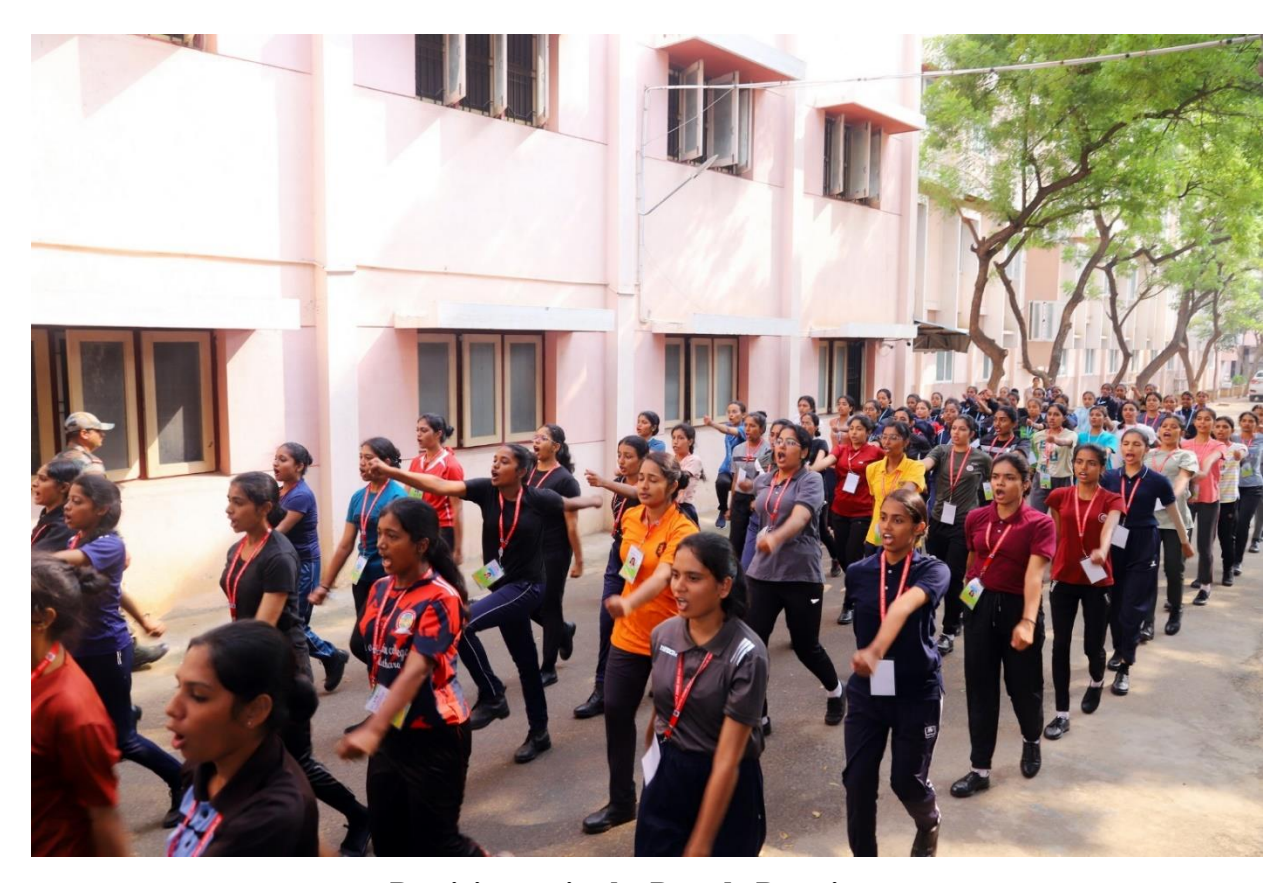
Participants in the Parade Practice