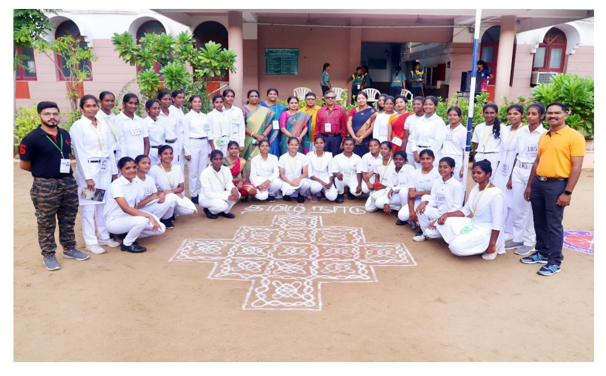
Group Photo of Tamilnadu Contingent with the Regional Director of NSS