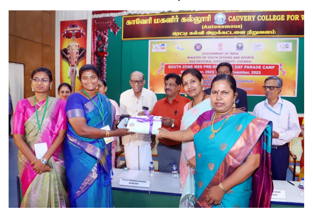
Tamilnadu Contingent received their participation certificate