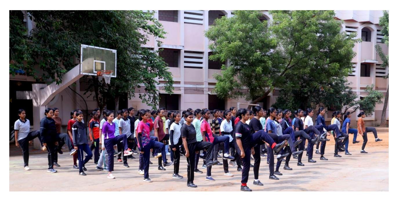
Participants during parade practice