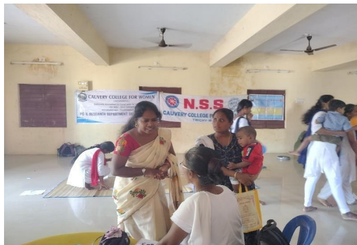
UBA volunteer engaging a child with drawing