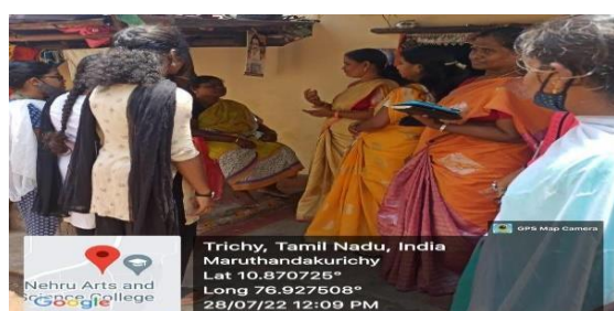
Caption: Identifying beneficiaries by home visits